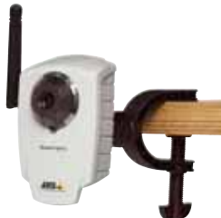
Cámara IP AXIS 207/207W/207MW con pinza flexible - pinza incluida