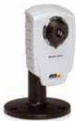
Cámara IP AXIS 207/207W/207MW con soporte - soporte incluido